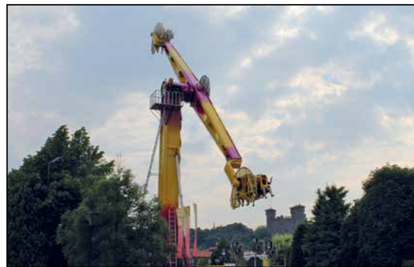
Luna Park da brividi.