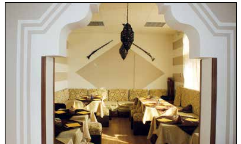
LA PRIMA SALA RISTORANTE

MENU' ALLA CARTA PIATTI DELLA CUCINA SIRIANA