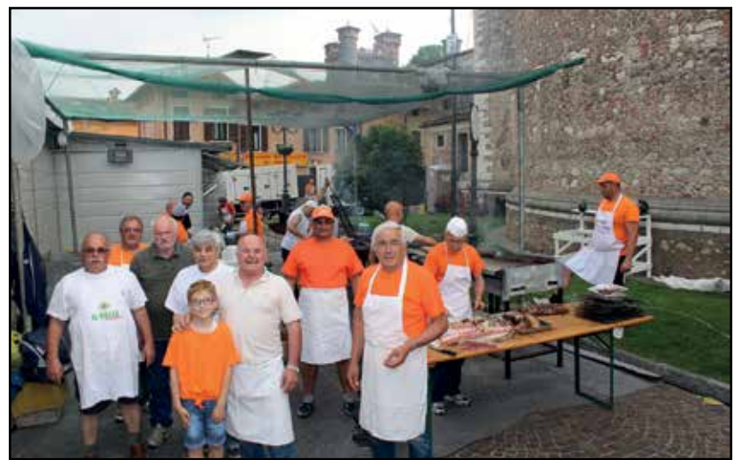
La gestione gastronomica affidata ai volontari di Vighizzolo.

Unico neo: essendo concentrati molti eventi in un solo giorno, non si è riusciti materialmente a vedere e sentire tutto ciò che era in programma, ed è stato un vero peccato! Al castello, per esempio, nel pomeriggio, c'era una coda molto lunga, sotto il sole, per cui parecchie persone hanno rinunciato ad entrare... C'è da mettere in conto, tuttavia, che è il primo anno di cambiamenti importanti per San Pancrazio, per cui è doveroso apprezzare e ringraziare chi ha organizzato il tutto per ambientare la festa del nostro patrono in un'epoca documentata, quindi più vera e sentita.