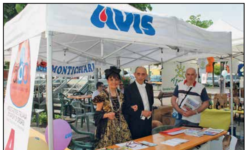
Lo stand Avis-Aido in versione S. Pancrazio.

Discrete le intenzioni di visita per il primo esame dell'Avis, ed oltre una quarantina le adesioni per l'Aido. Con queste nuove adesioni il numero complessivo sale a circa 920 soci, obiettivo che si avvicina ai mille