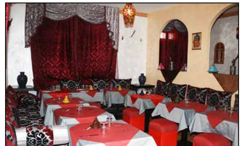
LA SECONDA SALA RISTORANTE

CUCINA ANCHE PER VEGETARIANI E VEGANI CON DOLCI SIRIANI