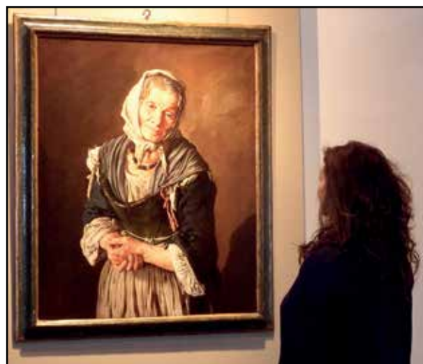
Ammirazione davanti ad un'opera d'arte del Pitocchetto.