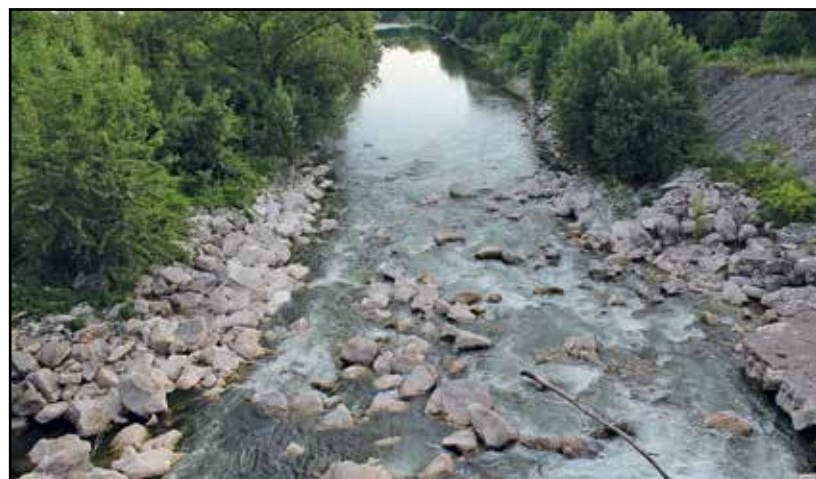
Un tratto del Chiese che attraversa Montichiari.

Viene così manifestata la volontà dell'interesse al progetto e di dare mandato agli uffici competenti di mettere in atto le consultazioni, gli approfondimenti, con il coordinamento della Provincia, in modo da verificare la possibilità di dare concreta attuazione alla creazione di una struttura convenzionata che consenta la realizzazione degli obiettivi del Parco Locale Sovra-Comunale.